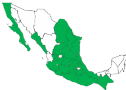
Estados en los que se ha realizado la búsqueda intencionada de SARS-CoV-2 en muestras provenientes del SISVEFLU