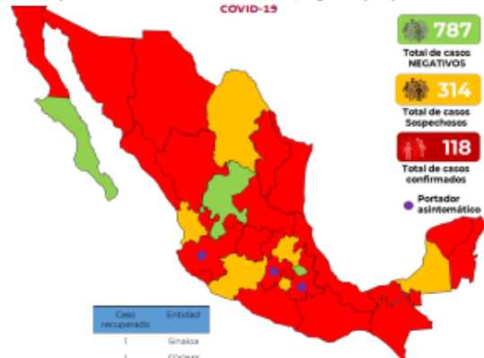
Mapa de México con los casos confirmados, negativos y sospechosos a COVID-19